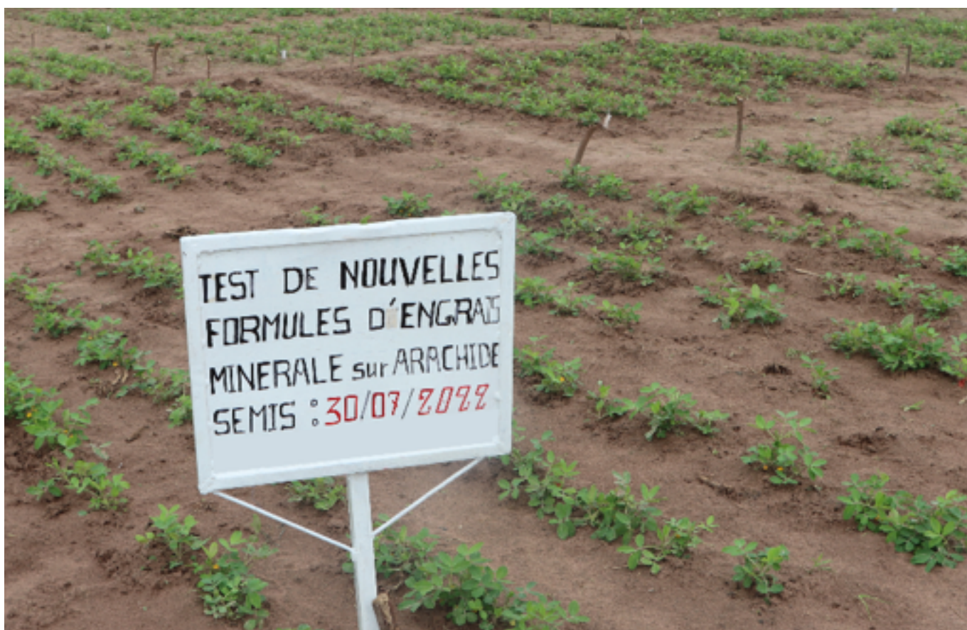
Photo 3 : Evolution des tests des formules sur l'arachide à la station de Niore (Kaolack – BAS)