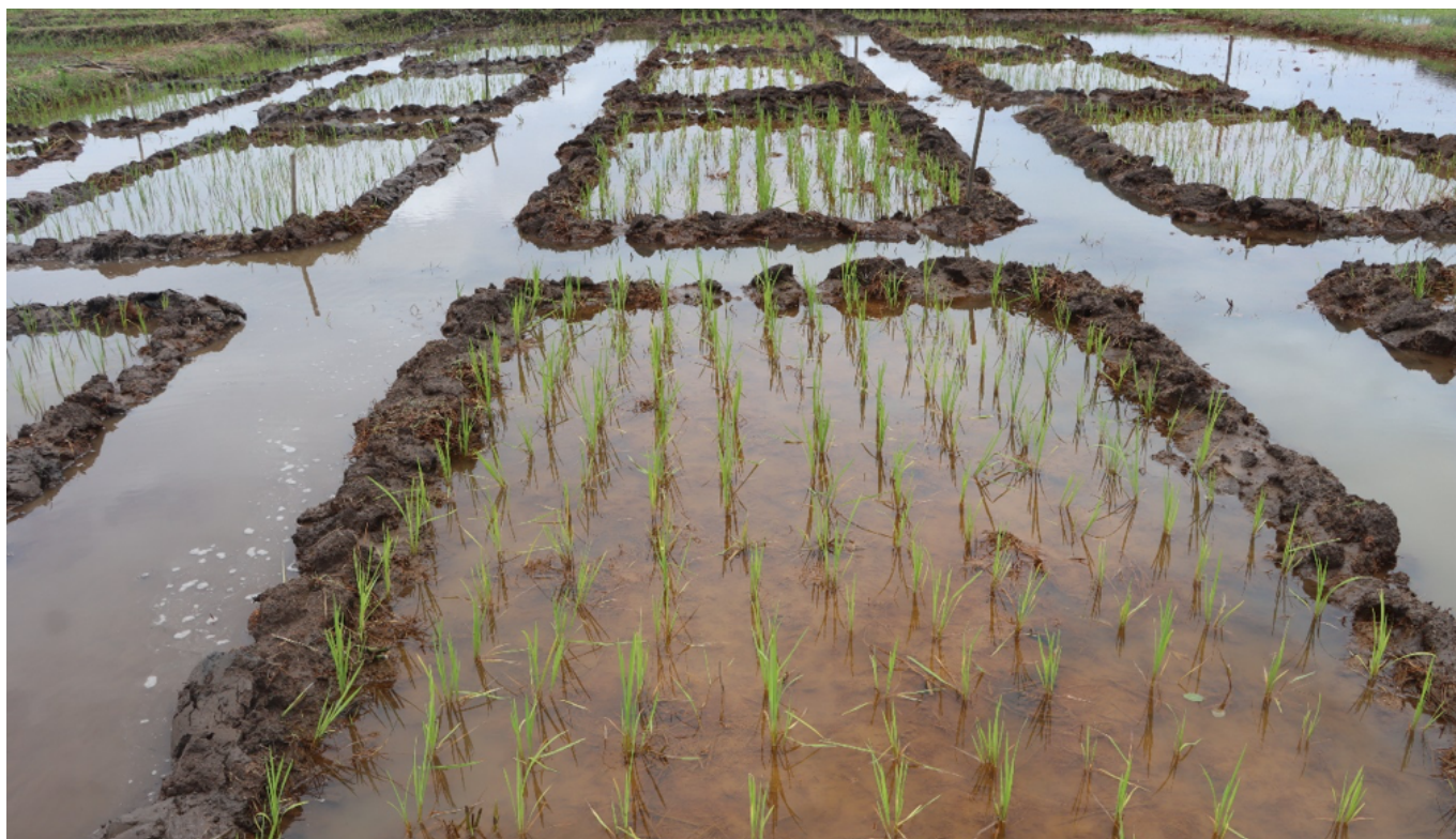
Photo 2 : Dispositif expérimentale des tests des nouvelles formules sur le riz à la station ISRA de Djibélor (Ziguinchor – Casamance)