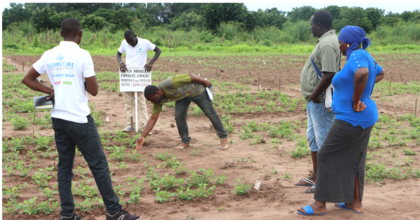
Photo 1 : Parcelle de test d'arachide à la station de l'ISRA à Nioro (Kaolack)

Le projet Dundël Suuf lance les tests sur l'étendue du territoire