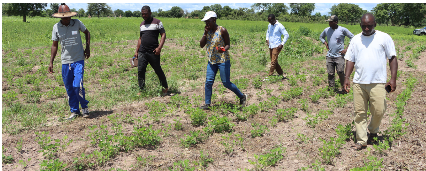
Photo 4 : Parcelle de test d'arachide au PAPEM de l'ISRA à Velingara (Casamance)