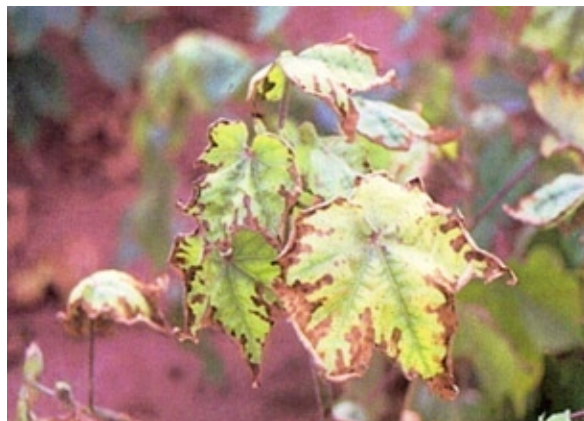
Effet d'une carence en Potassium.

La plus importante et fréquente est celle de "Potassium" qui se manifeste par un jaunissement des feuilles entre les nervures et des zones de nécroses brunes progressant du bord de la feuille vers l'intérieur de celle – ci entre les nervures. En cas de graves carences, le feuillage sèche sur la plante mais reste fixé aux branches. La production est réduite et la qualité de la fibre affectée.