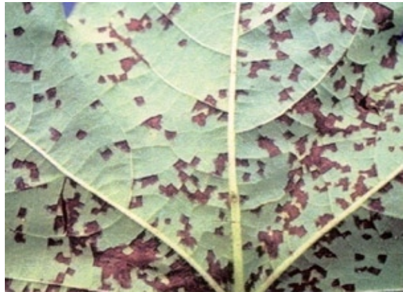
Bactériose sur la face inférieure d'une feuille de coton.