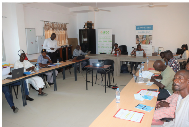
Participants à l'atelier de formation de Saint Louis (Vallée du Fleuve Sénégal)