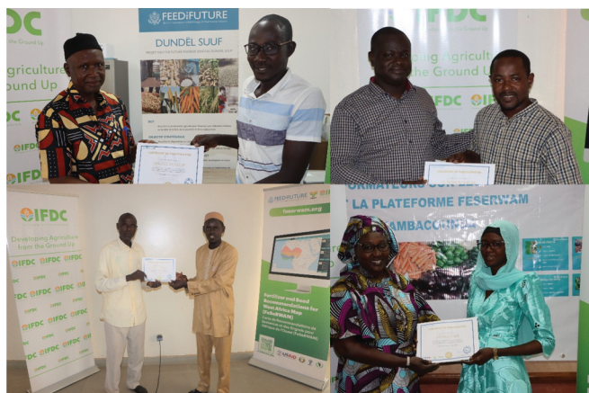
Remise de certificats aux participants

Une des perspectives à cette série de formation est que des démultipliations soient faites pour permettre une très large diffusion de ces outils comme support d'appui conseil et de formation des producteurs et des productrices pour leur permettre d'améliorer leur rendement et la productivité agricole.