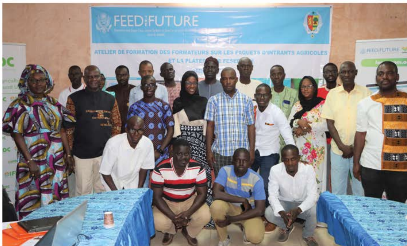
Participants à l'atelier de formation de Tambacounda (Sénégal Oriental)

Les bénéficiaires de la formation étaient composés d'agents des DRDR, des directions de zone de l'ANCAR, des OP comme le RESOPP et de la SODAGRI.