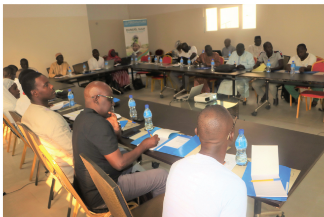
Participants à l'atelier de formation de Thiès (Niayes et Bassin arachidier)