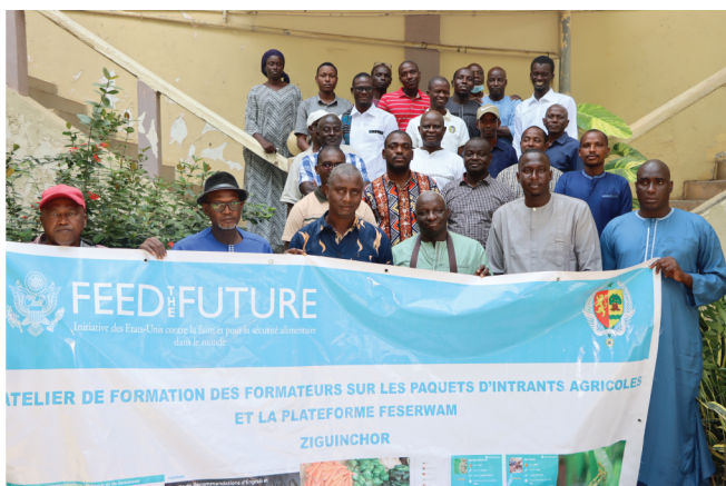
Participants à l'atelier de formation de Ziguinchor (Casamance)