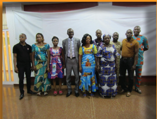
Le Service technique (ST) du Cadre de Concertation Intercommunale (CCIC) Zou s'est réuni

Le dispositif d'intervention du programme repose sur des concertations multi-acteurs : au sein des Pôles d'Entreprises Agricoles (PEA) et au niveau des Cadres de Concertation Inter Communaux (CCIC). Il revient aux acteurs locaux eux-mêmes, selon leurs expériences, d'aborder les causes susmentionnées et d'apporter des réponses