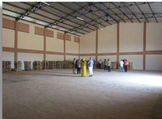
Un comité visite l'intérieur de l'entrepôt de maïs de 1 000 tonnes d'Ifangni