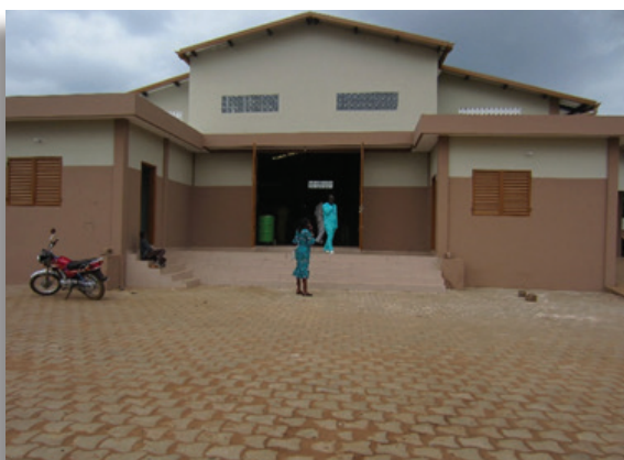
Ikpinlè dispose d'un entrepôt Gari de 1 000 tonnes

Ces infrastructures marchandes, qui ont été réalisées sous maîtrise d'ouvrage communale, ne jouent leur rôle (regroupement et stockage des produits, commercialisation collective) que si les dispositifs appropriés de gestion sont mis en place. Ces dispositifs impliquent la combinaison d'un ensemble de mesures : la mobilisation de l'offre ; le contrôle de la qualité ; le financement des opérations (préfinancement des achats auprès des producteurs, crédit warrantage) ; la mise en marché collective (gestion des stocks, contractualisation) et la gestion public-privé des infrastructures.