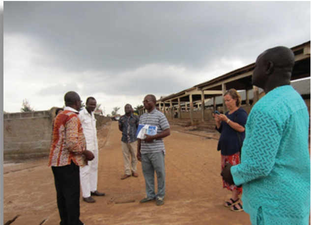
Le comité de suivi de l'ACMA visite les sites sur le terrain

Le marché étant dynamique, elle demeure la force motrice des changements induits. Par la suite, prioriser la flexibilité dans la facilitation des concertations au sein des PEA s'avère efficace. A cet effet, la demande sur le marché nigérian reste soutenue mais ce marché n'est pas tout de suite à la portée de tou(te)s les producteurs (trices) et transformateurs (trices) (volume et qualité exigés, frais des procédures formelles). C'est ce qui explique l'option prise par le programme ACMA d'identifier des opportunités de marché au Bénin et d'y faciliter l'accès.