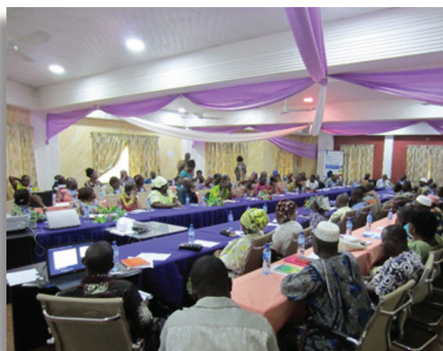
L'IFDC accueille l'atelier de révision du partenariat avec Alidé

Différents membres des PEA ont pu obtenir 942 millions Francs CFA de crédit auprès des institutions de microfinance en l'occurrence ALIDÉ partenaire du Programme ACMA. Ces crédits ont touché 1.498 bénéficiaires au total dont 740 femmes. Un volume total de 1.249 tonnes de produits (maïs, gari et huile de palme) a été warranté².