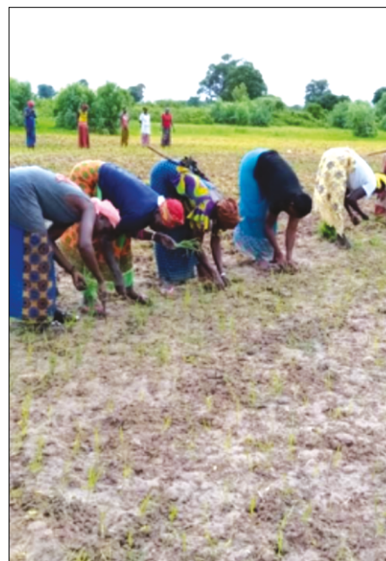
Installation de la parcelle de démonstration PPU riz de Djiguimar (Nioro du Rip)

Ce numéro de Flash Info, 3ème du genre, fait un zoom sur les principaux résultats de l'application des technologies de la MD et du PPU enregistrés dans la zone agroécologique du BA durant la première année de mise en œuvre du projet DS (2019-2020).