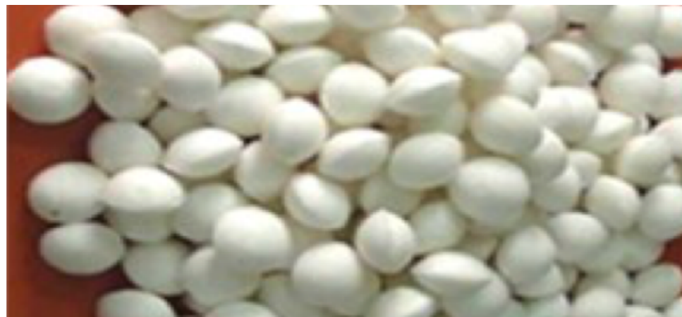
Granule d'urée ou Urée Super Granulée (USG) de 1.8 g

Elle consiste à appliquer, en un seul apport entre 7 et 10 jours après le repiquage, un granule d'urée de 1.8 g environ (voir photo 2) de façon localisée (40 cm entre les lignes) et à une profondeur de 7 à 10 cm, permettant de nourrir 4 plants de riz (voir photos 3 et 4).